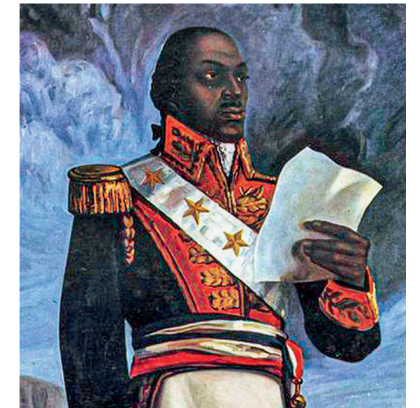
TOUSSAINT LOUVERTURE (1743–1803) , Anführer der Haitianischen Revolution.

1933 beurteilt werden müsste. Wir können aber gar nicht anders, als nach unseren heutigen Maßstäben zu urteilen. Entscheidend ist, ob sich diese Maßstäbe in einer historischen Epoche wiederfinden, und sei es nur als Denkmöglichkeit. Im Fall von Nettelbeck ist das leicht zu beantworten: Die transatlantische Sklaverei war von Anfang an, d. h. bereits im 16. Jahrhundert, der Kritik ausgesetzt — eine Ablehnung, die sich gegen Ende des 18. Jahrhunderts zu einer Massenbewegung steigerte. Als Nettelbeck in den frühen 1770er-Jahren auf Versklavungsschiffen zur See fuhr, gab es längst ein moralisches Unrechtsbewusstsein dieser Praxis.