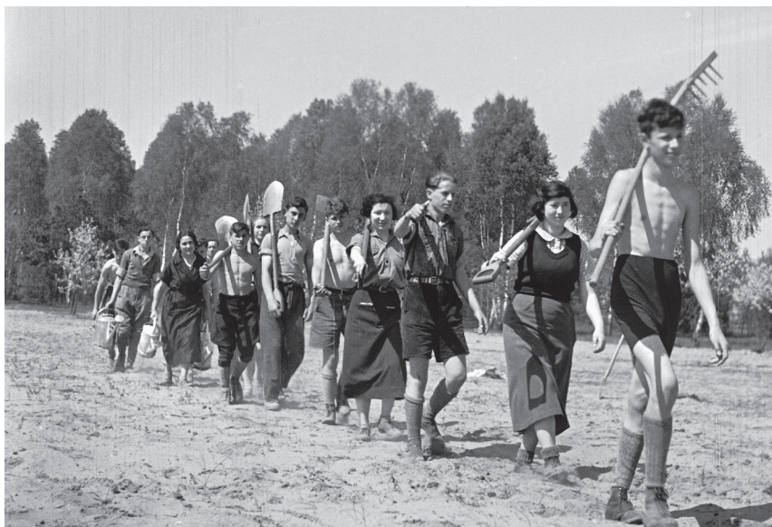
Aus einer Bilderserie über das Hachschara-Lager der Jugendalijah in Rüdnitz nordöstlich von Berlin, 1935

Die Eltern der beiden dagegen hatten keine Chance, von den britischen Behörden eine Einwanderungsgenehmigung für Palästina zu erhalten. Weder konnte der Vater den verlangten Beruf im landwirtschaftlichen oder handwerklichen Bereich nachweisen noch verfügte er über das alternativ geforderte Vermögen.