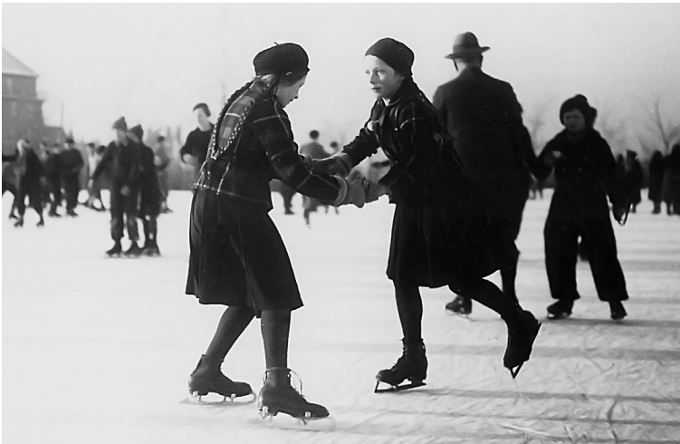
Mädchen beim Schlittschuhlaufen auf der Spritzeisbahn an der Arnstädter Straße, undatiert

»Mit dreieinhalb Jahren fing ich an zu schwimmen. [...] Und seit diesem Tag ist Schwimmen meine Leidenschaft geworden. Schon zu der Zeit, als Hitler an der Regierung war, musste ich einmal für unsere Schule schwimmen. Ich schwamm und siegte. Aber damals tat ich es nicht für die Schule, sondern der Sieg war meiner für die Jüdin,« schrieb Marion Feiner, damals schon in Palästina, am 13./14. September 1939 zum jüdischen Neujahrsfest Rosch ha-Schanah 5700 im letzten Eintrag in ihr Tagebuch.