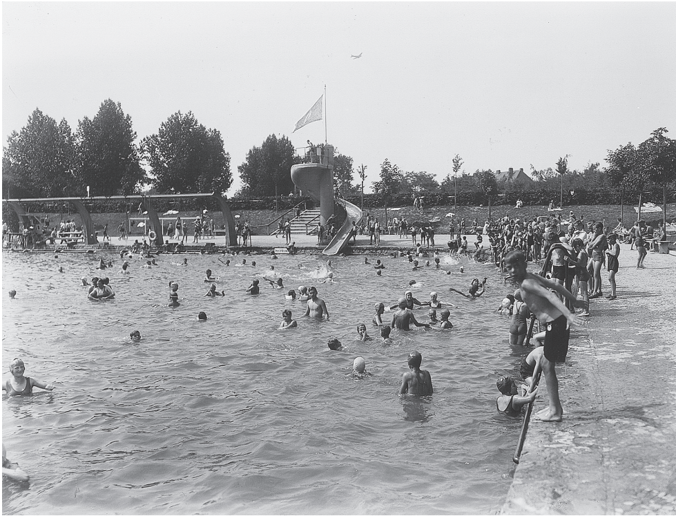
Nordbad, 1939