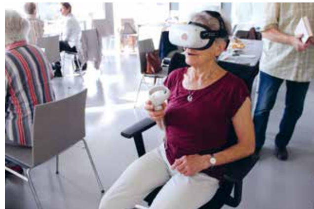
Die Erkundung der virtuell rekonstruierten Großen Synagoge mit einer VR-Brille begeistert Menschen jeden Alters.