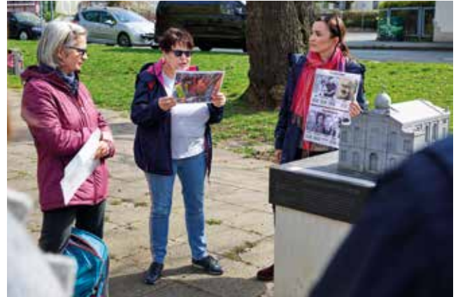
Inklusiver Stadtrundgang zur jüdischen Geschichte , gestaltet von Menschen mit und ohne Behinderung, hier am Tastmodell der Großen Synagoge Erfurt

12. September, 11 Uhr, Dauer ca. 120 Minuten