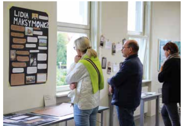
Jugendliche der Staatlichen Gemeinschaftsschule 1 ‚Friedrich Schiller‘ präsentieren Eltern und Lehrkräften im Erinnerungsort Topf & Söhne ihre kreative Auseinandersetzung mit ihrer Fahrt in die Gedenkstätte Auschwitz, 7. Mai 2025

Als außerschulische Lernorte entfalten die Gedenkstätten ein großes Potenzial: Sie können zu einer reflektierten historisch-politischen Urteilsbildung ermutigen, Zivilcourage stärken und das Lernen aus der Geschichte für eine gemeinsame europäische Zukunft fördern. Dazu sind eine fachlich fundierte Durchführung und eine entsprechende Vor- und Nachbereitung notwendig.