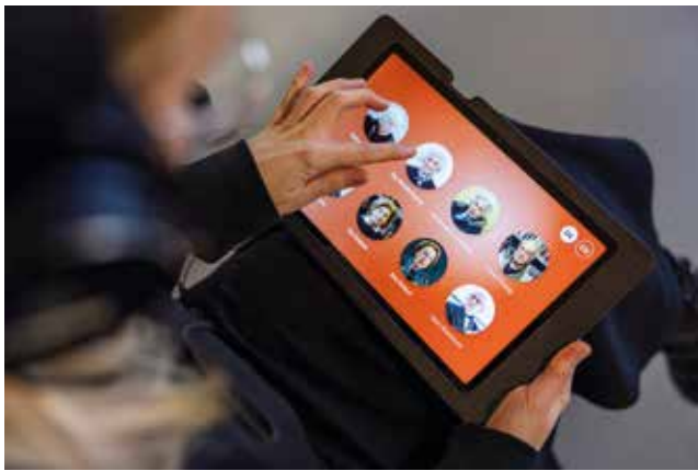
Auf Tablets können die Gäste Sequenzen aus Videointerviews mit acht Auschwitz-Überlebenden hören.

Für die gelungene Gestaltung dankt der Erinnerungsort Topf & Söhne dem Büro Weidner Händle Atelier in Stuttgart, das für die Vitrinestelen, Tafeln und Pulte verantwortlich zeichnet, und dem Büro Funkelbach in Leipzig, das die Installation Stimmen der Überlebenden und die hinterleuchteten Grafikelemente schuf.