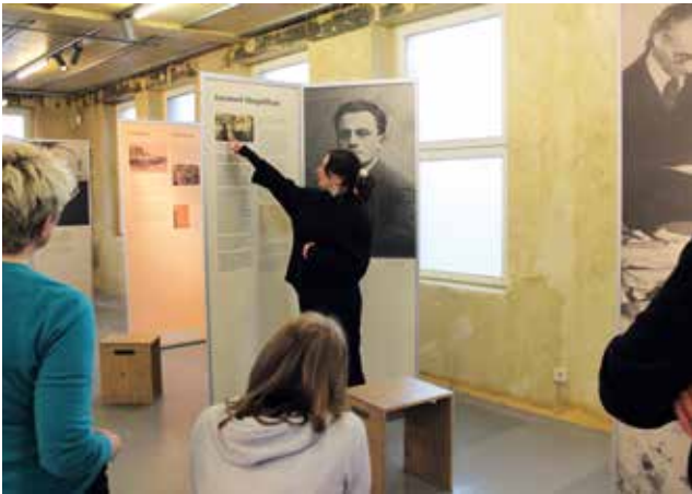
Führung in der Sonderausstellung Verfolgen und Aufklären

die Verbrechen begangen haben. Sie wollten Beweismaterial für spätere juristische Verfahren sammeln und das Andenken an die zahllosen Toten und die vernichtete jüdische Kultur bewahren.