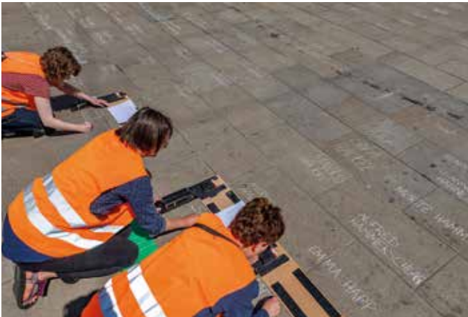
Am 9. Mai 2022, 80 Jahre nach der ersten großen Deportation, schrieben Menschen die Namen aller Jüdinnen und Juden aus Thüringen, die Opfer im Holocaust wurden, auf den Erfurter Bahnhofsvorplatz.

Der ehemalige Firmensitz von J. A. Topf & Söhne ist ein historischer Ort der Mittäterschaft der Industrie am Holocaust. Das Unternehmen stellte der SS leistungsstarke Öfen für die Beseitigung der Leichen in den Konzentrationslagern zur Verfügung und zögerte nicht, technische Lösungen zur »Optimierung« des Mordens im Vernichtungslager Auschwitz-Birkenau zu liefern. In der Führung, die Teile des Außengeländes und die Dauerausstellung Techniker der »Endlösung« umfasst, steht die Auseinandersetzung mit zentralen historischen Dokumenten im Zentrum der Betrachtung. Es geht sowohl um die Motive der beteiligten Firmenchefs, Ingenieure, Monteure und Kaufleute als auch um ihre Handlungsoptionen. Die Gäste haben dabei die Möglichkeit, sich über die Geschichte der Firma Topf & Söhne und deren Geschäftsbeziehungen zur SS zu informieren und die durch die Ausstellung aufgeworfene Frage nach der Verantwortung des einzelnen Menschen im beruflichen Alltag im Gespräch zu reflektieren.