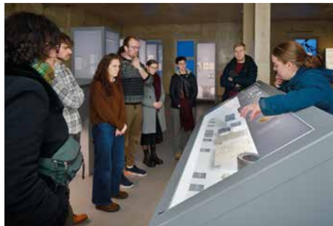
Die Dokumente im Pult belegen die Mittäterschaft von Topf & Söhne im Konzentrationslager Buchenwald.

Öffentliche Führung durch die erneuerte Dauerausstellung Techniker der »Endlösung«