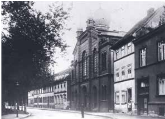
Eines der wenigen überlieferten Bilder der Großen Synagoge Erfurt, das für die virtuelle Rekonstruktion genutzt wurde, undatiert