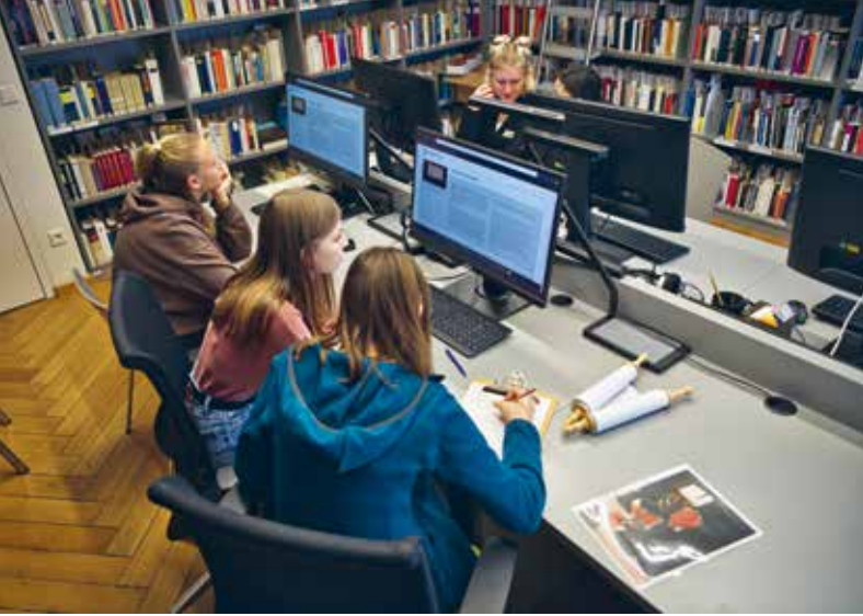
An den Medienstationen in der Bibliothek: Forschendes Lernen über jüdische Religion und Geschichte

Mit der Erneuerung und Erweiterung der Dauerausstellung Techniker der »Endlösung« hat der Erinnerungsort seine Bildungs- und Vermittlungsarbeit weiterentwickelt. Anliegen ist, allen Besucherinnen und Besuchern – unabhängig von Vorwissen oder sprachlichen Voraussetzungen – einen reflektierten und zugleich verantwortungsethisch fundierten Zugang zur Geschichte der Firma Topf & Söhne zu ermöglichen. Die Arbeitsblätter zur Dauerausstellung wurden deshalb umfassend überarbeitet. Dokumente werden nun noch detaillierter erschlossen, Fragen führen Schritt für Schritt durch die historischen Quellen. Diese Struktur unterstützt Lernende dabei, ein begründetes Sachurteil zu zentralen Fragen zu entwickeln: Was wussten die Beteiligten? Welche Motive leiteten ihr Handeln? Auf dieser Grundlage ermöglicht die Auseinandersetzung mit der Ausstellung ein differenziertes Werturteil – angepasst an unterschiedliche Anforderungsniveaus. Die Auseinandersetzung mit Verantwortung, Handlungsspielräumen und Rollen der damaligen Akteure steht dabei im Zentrum. Verantwortungsethische Fragen werden damit nicht abstrakt, sondern quellenbasiert und historisch verankert diskutiert.