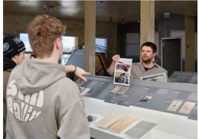
An Pult 1 der Dauerausstellung im Rahmen einer Führung

Das Seminar verbindet forschendes Lernen mit der Förderung eines kritischen Geschichtsbewusstseins.