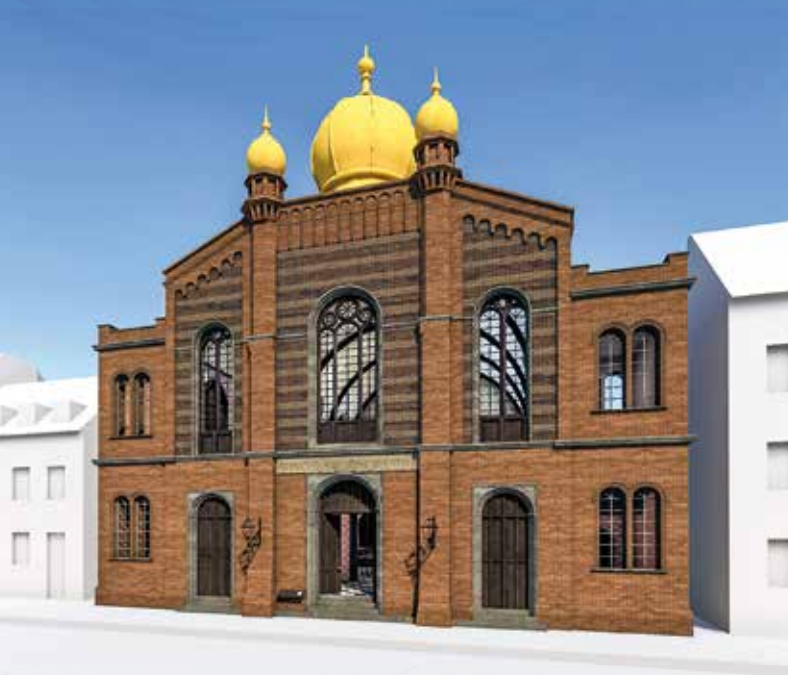
Vorderansicht der 2021 virtuell rekonstruierten Großen Synagoge Erfurt