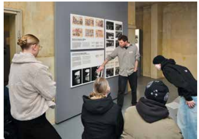
Fotos und Zeichnungen aus Auschwitz-Birkenau werden in neuer Gestaltung präsentiert.

Im Rahmen der Veranstaltungsreihe Bücher aus dem Feuer