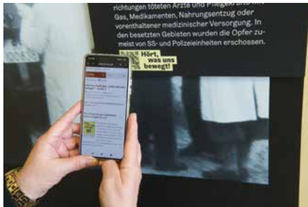
In der Audiospur Hört was uns bewegt! erläutern Guides mit und ohne Beeinträchtigung ihre Perspektive auf die Ausstellung Wohin bringt ihr uns?

Wie aus staatlicher Verantwortung für die Bürgerinnen und Bürger in der Gesundheitsfürsorge im Nationalsozialismus staatlich beauftragte Verbrechen wurden, wird in der »Aktion T4« deutlich, der ersten planmäßigen Vernichtung von Menschenleben im Nationalsozialismus. Verschleiert als »Euthanasie« (griech. »schöner Tod«) wurden 1940/1941 70.000 Menschen mit Behinderungen und psychischen Erkrankungen systematisch ermordet.