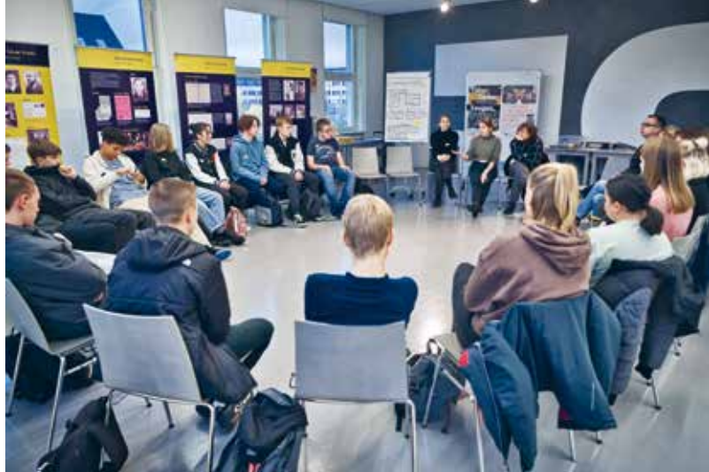
Gruppendiskussion im Seminar Zusammenleben in Vielfalt