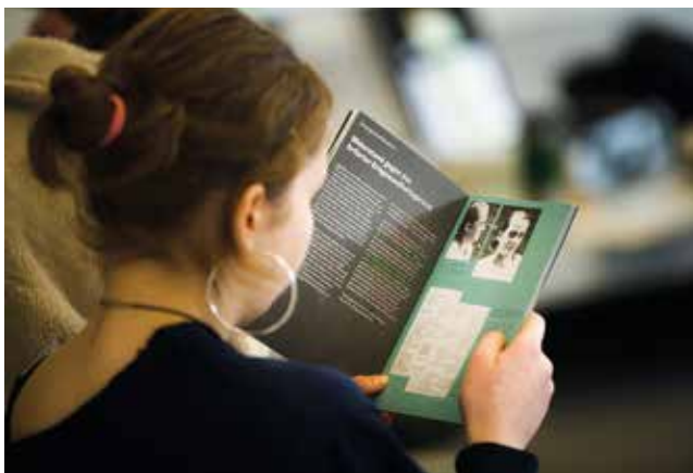
Begleitbroschüre mit den Inhalten der Ausstellung

Mit Beginn des Zweiten Weltkriegs wurde die schon länger geplante, gezielte Ermordung von Menschen in Heil- und Pflegeanstalten in die Tat umgesetzt. Unter der Leitung der Kanzlei des Führers koordinierte eine Abteilung mit Sitz in der Tiergartenstraße 4 in Berlin die Organisation und Verschleierung des ersten nationalsozialistischen Massenmordes, der »Aktion T4«.