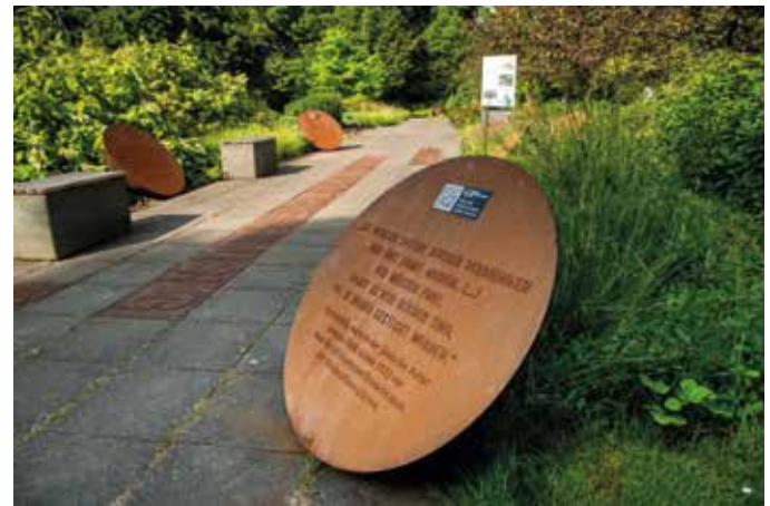
Der Denkort Bücherverbrennung 1933 erinnert an die von den Nationalsozialisten vernichtete Kultur.

Auf der Webseite des egaparks befindet sich unter Denkort Bücherverbrennung 1933 eine Unterseite Workshop Bücherverbrennung und Menschenfeindlichkeit mit allen Materialien, um dieses Bildungsangebot selbst durchzuführen. Weitere Unterseiten machen dort Audios mit Lesungen der Schotte aus verbrannten und verbotenen Büchern sowie viele Informationen zur Geschichte und zum Denkmal zugänglich: https://t1p.de/denkort