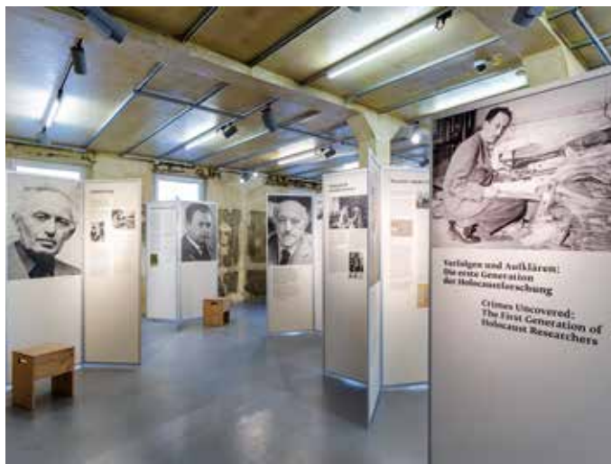
Blick in die Ausstellung Verfolgen und Aufklären

Sogar nach 1945 war sie nicht selten Gewalt und staatlichem Druck ausgesetzt – die vielfachen Fluchten und Migrationen dieser Überlebenden berichten davon. So sind ihre Biographien zugleich eine Verpflichtung, ihre Errungenschaften auf wissenschaftlichem und praktischem Gebiet gegen jene zu verteidigen, die sie anzweifeln und offen infrage stellen. Die Ausstellung möchte dazu beitragen, das Wissen über den Holocaust und die Erinnerung an die zerstörten jüdischen Lebenswelten lebendig zu halten und zur eigenen Auseinandersetzung damit anzuregen.