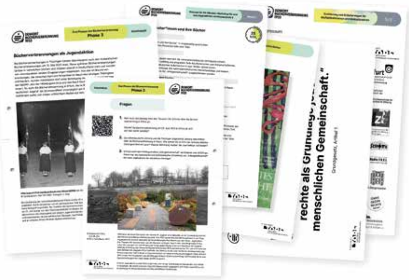
Materialien im Seminar zur Bücherverbrennung © Funkelbach – Büro für Architektur + Grafikdesign