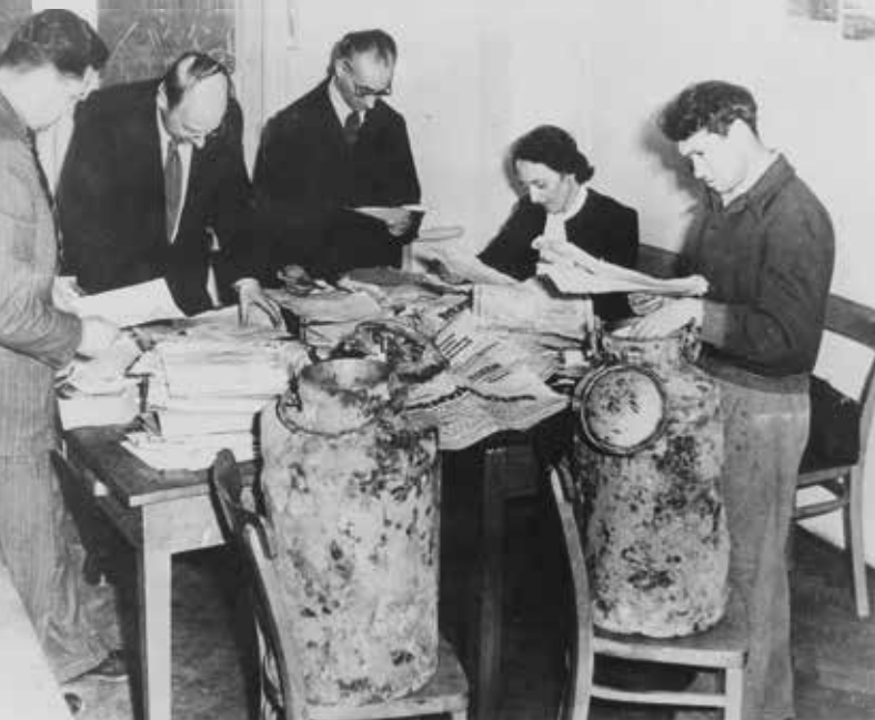
Mitglieder der Jüdischen Historischen Kommission bei der Sichtung von gerade geborgenen Teilen des Oyneg Shabes-Archivs in Warschau, 1950