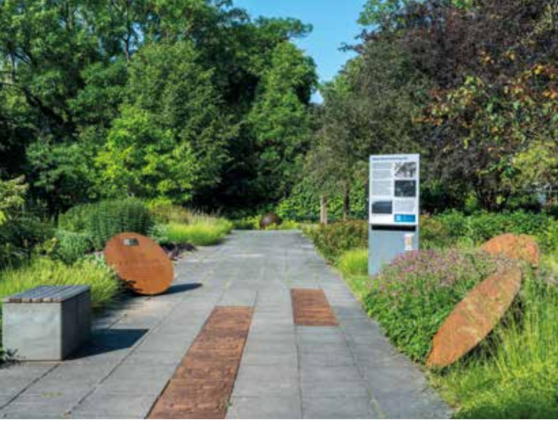
Der Denkort Bücherverbrennung 1933 im egapark