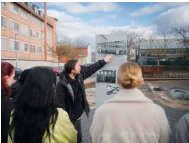
Die Stelen in der Außenausstellung zeigen in der Blickachse aufgestellte historische Fotos vom Firmengelände.

In der dialogischen Führung, die Teile des Außengeländes und die Dauerausstellung Techniker der »Endlösung« umfasst, steht die Auseinandersetzung mit zentralen historischen Dokumenten zur Mittäterschaft von J. A. Topf & Söhne an der Shoah im Zentrum der Betrachtung. Die Besucherinnen und Besucher haben dabei die Möglichkeit, sich über die Geschichte des Unternehmens und dessen Geschäftsbeziehungen zur SS zu informieren und miteinander über die Frage nach der Verantwortung des einzelnen Menschen im beruflichen Alltag in Austausch zu treten.