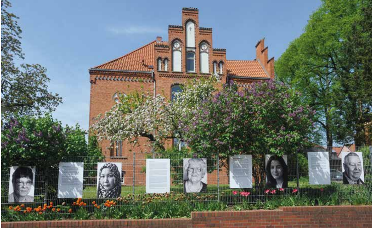
Die Ausstellung Flüchtlingsgespräche in Sternberg in Mecklenburg-Vorpommern