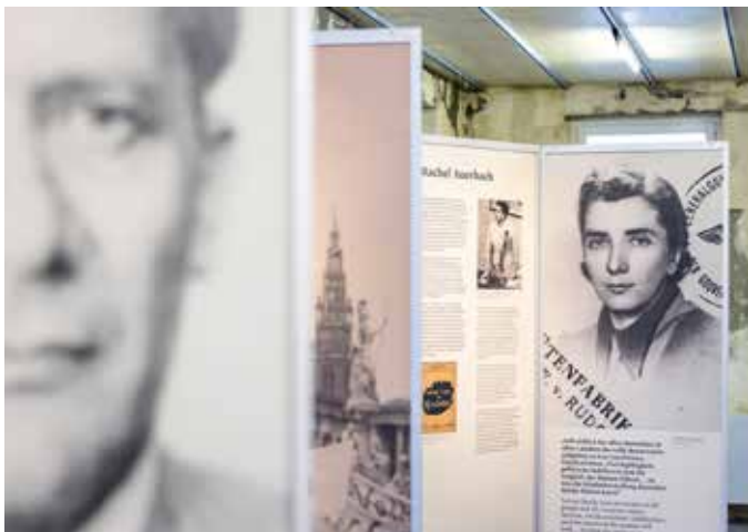
Rachel Auerbach ist eine Protagonistin in der Ausstellung Verfolgen und Aufklären . Sie etablierte Überlebendenberichte als elementaren Bestandteil der Holocaustforschung.