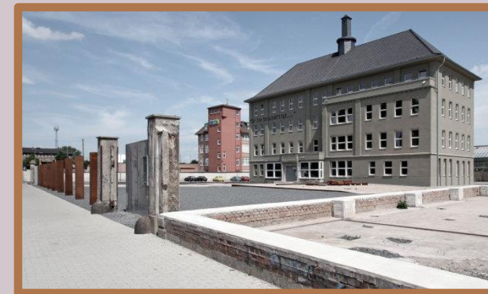
Der Erinnerungsort „Topf & Söhne - Die Ofenbauer von Auschwitz“ im ehemaligen Verwaltungsgebäude der Firma „J.A. Topf & Söhne“ in Erfurt

Der Erinnerungsort „Topf & Söhne - Die Ofenbauer von Auschwitz“ befindet sich in Erfurt auf dem ehemaligen Gelände des Unternehmens. Dort kann man sich eine Dauerausstellung zur Firma und wechselnde Sonderausstellungen mit Bezug zum Nationalsozialismus ansehen sowie Führungen, Lesungen und Vorträge verfolgen. Das Geschichtsmuseum leistet unter dem Motto „erinnern - verstehen - begegnen - gedenken“ einen wichtigen Beitrag zur kritischen Auseinandersetzung mit der Geschichte, der notwendig für eine demokratische und pluralistische Gesellschaft ist.