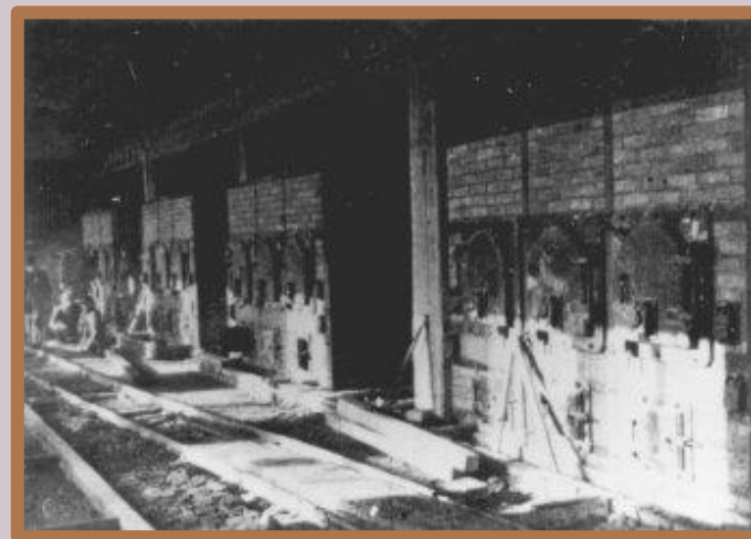
Vier von fünf Dreimuffelöfen der Firma im Krematorium II von Auschwitz-Birkenau