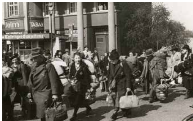
Eisenach 9. Mai 1942 Ein von der Stadt beauftragter Fotograf dokumentierte in insgesamt 20 Aufnahmen den Weg von 58 Menschen vom Sammellort Goethestraße 48 bis zum Bahnhof. Keine*r von ihnen kehrte zurück. Im Hintergrund sind die Zuschauer*innen erkennbar.

Für Ihre Beteiligung an den Schreibaktionen ist eine Anmeldung erforderlich: www.schreiben-gegen-das-vergessen.eu