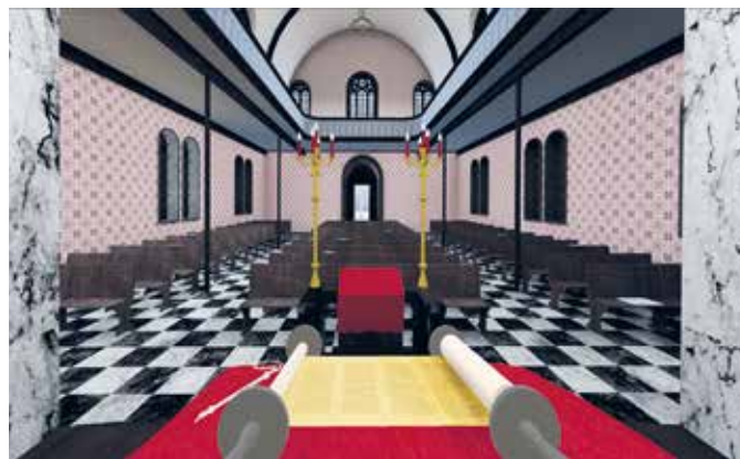
Blick auf die Tora und den Innenraum in der virtuell rekonstruierten Großen Synagoge